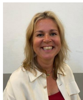
I. Noteltiers Rector

namens de medewerkers van de Simon van Hasseltschool,